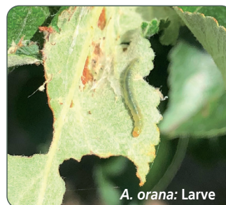
A. orana : Larve

Die 2. Generation der Raupen erscheint, je nach Schalenschwärmer-Art, ab Juli und August. Sie fressen bis Anfang Oktober an Trieben und Früchten, bevor sie sich zur Überwinterung zurückziehen. In warmen Jahren kann sich im September noch eine 3. Generation des Fruchtschalenschwärmers entwickeln.