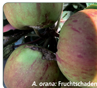
A. orana : Fruchtschaden